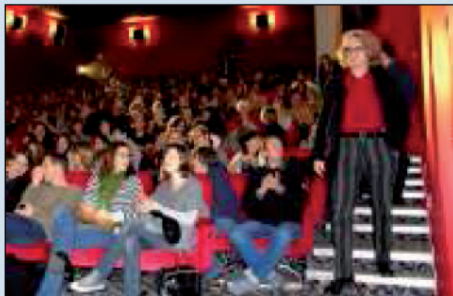
Lässiger Promi-Gast: Wim Wenders spazierte durchs Harmonie-Kino, stellte hier seinen Film „Palermo Shooting“ vor